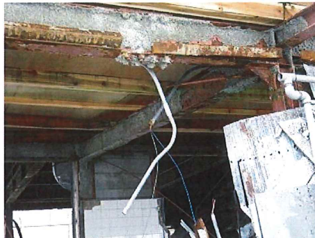
建物に残存した吹付け材