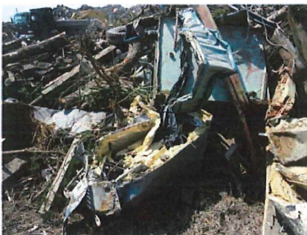
津波で流された断熱材