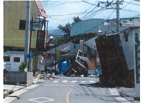
地震で損壊した建物